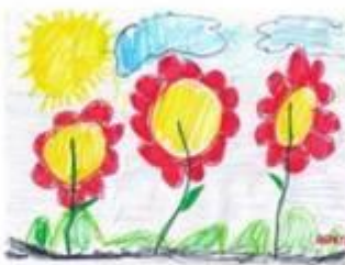
Рисунок Ифратина Байбака