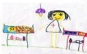
Рисунок Саад Тимченко